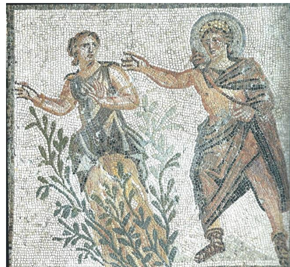
Mosaïque d'Apollon et Daphné. Maison de Ménandre